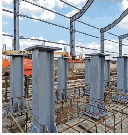
निरीक्षणार्थ मेट्रोक सपोर्टिंग कालम लगाने का काम जारी है।