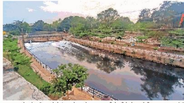
राजवाड़ा क्षेत्र में भूमिगत मेट्रो ट्रेक खोना। ट्रेन कान्ह नदी के नीचे से गुजरेगी। ● कहत फोटो

भूमिगत मेट्रो ट्रेक तैयार करने के लिए टनल बोरिंग मशीन का उपयोग किया जाएगा। यह मशीन जमीन में 60 फीट गहराई पर सुरंग बनाती जाएगी और सीमेंट कॉन्क्रीट के सेगमेंट डालती जाएगी। मशीन कैम्बल आगे बढ़ता जाएगा। निर्माण के दौरान धरातल पर मौजूद इमारतों में रहने वाले लोगों को निर्माण कार्य चलने का एहसास तक नहीं हो पाएगा। मुंबई में तो 30 मंजिला इमारत के नीचे भी टनल बनाकर