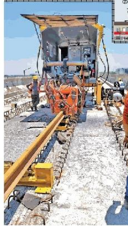
मेट्रो की रेल पटरियों को बिछाने के पूर्व रेल पटरियों की वेलिंडिंग का काम तेजी से जारी है। नईदुनिया

गांधी नगर डिपो-गांधी नगर स्टेशन-सुपर कारिडोर 6-सुपर कारिडोर 5-सुपर कारिडोर 4-सुपर कारिडोर 3