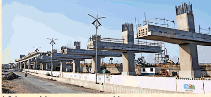
तेजी से चल रहा मेट्रो लाइन का काम। ● फाइल फोटो