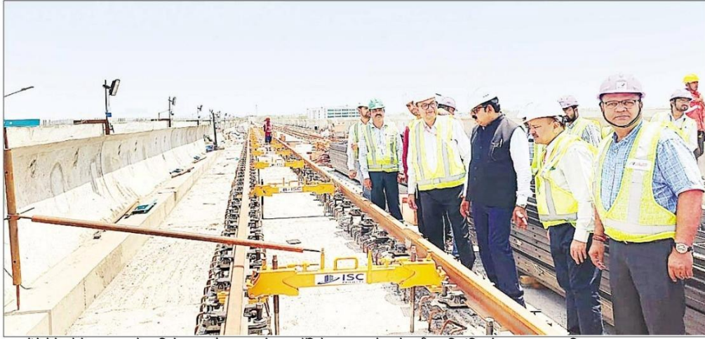
शहर में मेट्रो ट्रेन प्रोजेक्ट का काम तेज गति से चल रहा है। बुधवार को सुपर कॉरिडोर पर मुख्य स्टेशन के समीप पटरियाँ बिछाने का काम शुरू कर दिया गया।