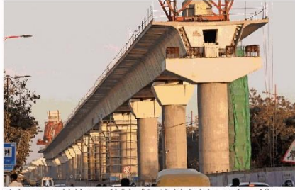
इंदौर के एमआर 10 पर मेट्रो प्रोजेक्ट का कार्य तेजी से जारी है। हमारे फोटो सेमेट के जोड़ा जा रहा है। * नईदुनिया

इंदौर (नईदुनिया प्रतिनिधि)। इंदौर और भोपाल में चल रहे मेट्रो प्रोजेक्ट के लिए प्रदेश सरकार ने करीब 700 करोड़ रुपये का प्रविधन इस बजट में किया है। जिससे उम्मीद है कि काम और तेजी से चलेगा। हालांकि इंदौर मेट्रो प्रोजेक्ट करीब 7500 करोड़ रुपये का है। जिसके लिए केंद्र सरकार भी मदद दे रही है। इंदौर मेट्रो ट्रेन के टूटल रन का लक्ष्य अगस्त में रखा गया है। जिसके लिए सुपर प्रायोटी कारिडोर पर 5.9 किलोमीटर हिस्से का निर्माण काफी तेजी से किया जा रहा है। वहीं डिपो में पटरी बिछाने का काम भी शुरू हो गया है। जबकि मई से कोच भी आना शुरू हो जाएगी।