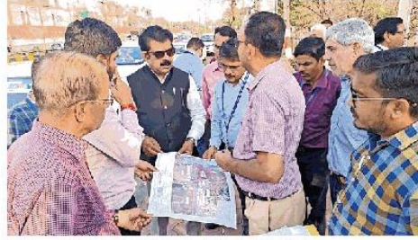
इंदौर एयरपोर्ट से 200 मीटर दूरी पर बनेगा मेट्रो स्टेशन।