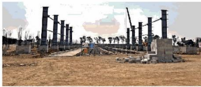
मेट्रो के लिए गांधी नगर में बन रहे डिपो के समीप तेजी से अलग-अलग स्टाचर बनाए जा रहे हैं। ●नईदुनिया

जैसे विमान का रनवे, वैसा मेट्रो का लैडिंग वे गांधी नगर स्टेशन से डिपो में ट्रेन लाने-ले जाने के लिए लैडिंग वे भी बन रहा है। इसके लिए 17 विराट पिलर तैयार हो चुके हैं। लैडिंग वे को हम इस तरह समझ सकते हैं कि जैसे विमान