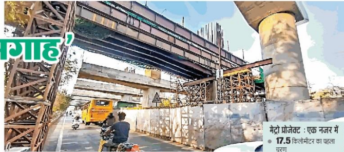
शहर में मेट्रो के स्टेशन बनाने का काम भी अब रफ्तार पकड़ चुका है। रिक्रान चौखण्ड पर बन रहे मध्य स्टेशन का ढांचा अब दिखाई देने लगा है।

मिनी मेट्रो इंदौर में मेट्रो ट्रेन का काम अब उसी तेजी से चल रहा है, जिस तेजी से यह शहर हर काम में दौड़ता है। लंबे ट्रेक का काफी कुछ हिस्सा तैयार होने के बाद अब उस लैडिंग-वे के 17 पिलर भी तैयार हो चुके हैं, जो मेट्रो ट्रेन को डिपो और शहर में विछी पटरियों के बीच लाने-ले जाने में काम आएगा। मेट्रो का काम जिस रफ्तार से चल रहा है, उसे देख लगता है कि इस वर्ष के मध्य में जो डेडलाइन तय की गई है, तब तक इंदौर को अपनी पहली मेट्रो ट्रेन को ट्रेक पर दौड़ते देखने का आनंद मिल सकेगा।