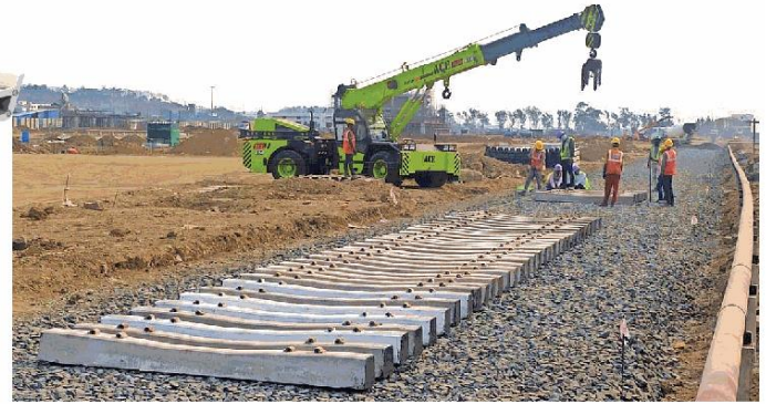
गांधीनगर मेट्रो ट्रेन के लिए शुक्रवार से स्लीपर बिछाने का काम शुरू हो गया है। स्लीपर सेट होने के बाद इन पर पटरियाँ बिछाई जाएगी। ● नईदुनिया

जानकारी के अनुसार कि 31.5 किमी का ट्रेक पूरा होने के बाद 28 ट्रेन चलेंगी। स्टेशनों की दूरी के अनुसार एक से तीन मिनट में ट्रेन स्टेशन पर पहुँचेंगी। जमीन से ऊँचाई पर बना मेट्रो ट्रेक भले ही दिखने में छोटा लगता है, लेकिन इस पर एक साथ दो ट्रेन चल सकेंगी, वहीं दोनों ट्रेन ट्रेक पर ही एक दूसरे को क्रॉस कर सकेंगी। ऐसा नहीं होगा कि एक ट्रेन स्टेशन पर हो, तभी ही दूसरी उसे क्रॉस कर सके।