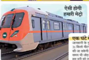
एसी होगी हमारी मेट्रो