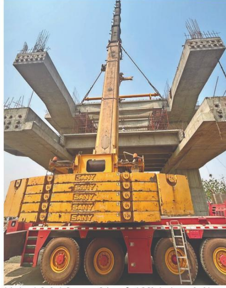
मेट्रो स्टेशन के निर्माण के लिए सुपर कारिडोर पर चीन में निर्मित मेगा क्रेन बुलाई गई है। इस क्रेन की मदद से 22 और 44 टन वजन की गर्डर लगाई जा रही है।

सुपर कारिडोर पर गांधी नगर से ओवरब्रिज तक के 5.9 किलोमीटर के हिस्से को सुपर प्रायोरिटी कारिडोर बनाया गया है। यहाँ पर अगस्त में ट्रायल रन का लक्ष्य रखा गया है। इसके लिए मेट्रो स्टेशन का काम तेजी से चल रहा है। यहां पर स्टेशन का काम भी चल रहा है। इसके लिए गर्डर लगा कर उन्हें जोड़ा जा रहा है। मेट्रो प्रोजेक्ट से जुड़े अधिकारियों के अनुसार यहां पर क्रेन की सहायता से गर्डर लांच करने का काम किया जा रहा है। यह क्रेन अभी गुजरात से आई है। वहां से एक अन्य क्रेन भी आने वाली है। मूलतः क्रेन चायना से आई है।