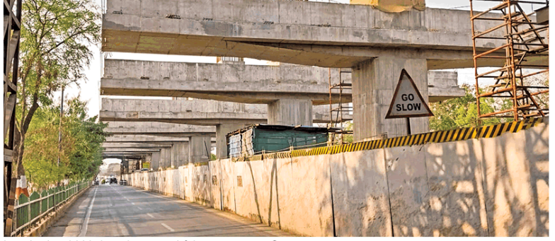
रॉडसन होटल के सामने मेट्रो ट्रेन के लिए स्टेशन का निर्माण तेजी से किया जा रहा है।

इंदौर मेट्रो परियोजना में पहले चरण का 17.5 किलोमीटर का काम चल रहा है। एक हिस्से का काम रेल विकास निगम व दूसरे का काम दिलीप बिल्डकॉन द्वारा किया जा रहा है।