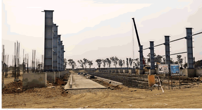
गांधी नगर में बन रहे मेट्रो ट्रेन के डिपो में फिलहाल सिविल कार्य तेजी से जारी है। • नईदुनिया

गांधी नगर में बना रहे 75 एकड़ का विशाल डिपो, अगस्त में होना है ट्रायल रन