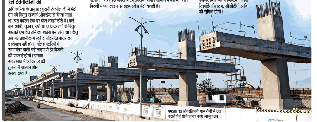
एमआर 10 ओवरब्रिज के पास तेजी से चल रहा है मेट्रो प्रोजेक्ट का काम। रानू पवार

इंदौर मेट्रो अत्याधुनिक सिग्नलिंग तकनीक ग्रेड आफ आटोमेशन-4 और अनऑटोडेड ट्रेन आपरेशन मोड (ड्राइवरलेस) पर आधारित होगी। अत्याधुनिक टेलीकम्युनिकेशन (दूरसंचार) सिस्टम के तहत इमरजेंसी हेल्प पाबट सिस्टम, पब्लिक एड्रेस सिस्टम, पैसेंजर इनाफोमेशन सिस्टम, वायस रिफ्लेक्स सिस्टम, सीसीटीवी आदि की सुविधा होगी।