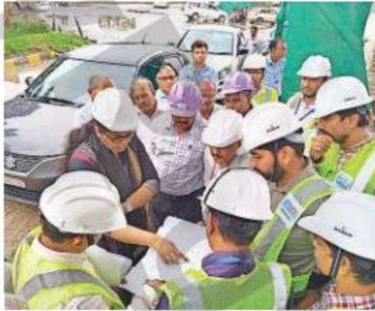
निगमायुक्त ने मेट्रो प्रोजेक्ट की समीक्षा की और निरीक्षण भी किया। • नईदुनिया

आयुक्त ने वर्षाकाल के दौरान मेट्रो के निर्माण कार्य प्रभावित होने के बारे में कंपनी के अफसरों से पूछा तो उन्होंने बताया कि जिस हिस्से में ट्रायल रन होना है, उसके स्टेशन निर्माण के दौरान फाउंटेशन व स्ट्रक्चर संबंधित कार्य हो चुका है। ऐसे में वर्षा शेष निर्माण कार्य में बाधक नहीं बनेगी। निगमायुक्त ने रेल पटरियां ब्रिजाने के दौरान गिट्टी (बालास्ट) की उपलब्धता की जानकारी मांगी। इस पर अधिकारियों ने बताया कि जितनी गिट्टी की जरूरत है वह पहली ही बुलवा ली गई है। ऐसे में वर्षा से खदानों से बालास्ट लेने की जरूरत नहीं होगी। निगमायुक्त हर्षिका सिंह ने मेट्रो प्रोजेक्ट के अंतर्गत शहर के विभिन्न स्थानों में चौराहे से हटाई गई रोटी,