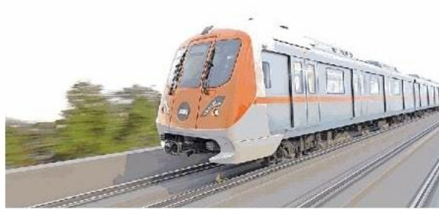
नईदुनिया सबसे पहले : इंदौर में चलने वाली मेट्रो ट्रेन इस तरह दिखाई देगी। • लौ लोटो प्रबंधन

प्लेटफार्म स्क्रीन डोर खुलने पर मेट्रो में चढ़ पाएंगे यात्री : मेट्रो ट्रेन में एलईडी डिस्के ब्रॉड रहेंगे, जिन पर स्टेशन के नाम होंगे। अनाउंसमेंट सिस्टम