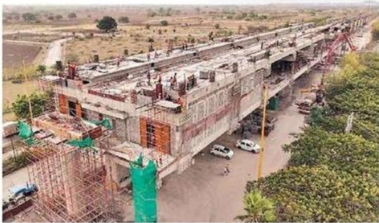
Metro Station at Super Corridor-5

On the priority corridor which is majorly between Gandhi Nagar Depot and