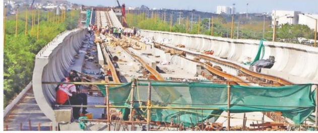
गांधीनगर से सुपर कारिडोर के बीच मेट्रो का ट्रायल रन पूरा करने के लिए इस ट्रेक को सितंबर तक तैयार करना है।

कर कर रहे हैं। मेट्रो ट्रायल रन वाले 5.9 किमी हिस्से में से अभी 800 मीटर में पटरियों के बिछाने का कार्य शेष है। वर्षा के कारण पटरियों की वेलडिंग भी ठीक से नहीं हो पा रही।