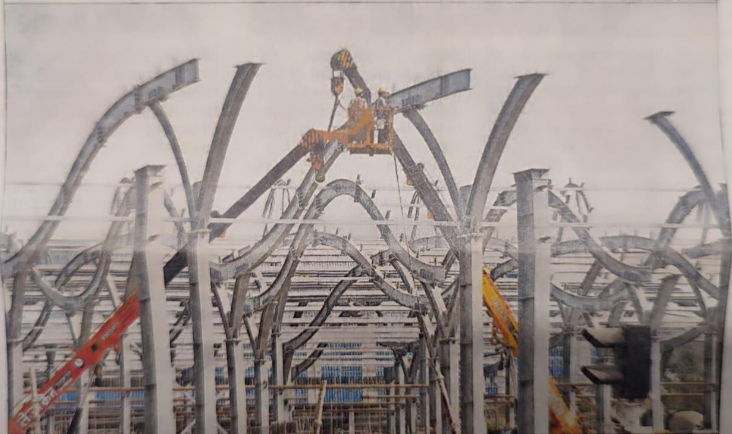
Workers constructing a shed at Gandhi Nagar Metro station in Indore