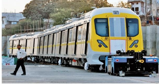
डिपो परिसर में पहुंचे मेट्रो के चौथे कोच सेट को पटरियों पर उतारा गया। • लणु प्रकाश

इंदौर (नईदुनिया प्रतिनिधि)। बुधवार को गांधी नगर डिपो में मेट्रो के कोच के चौथा सेट ट्राले से अनलोड कर विशेष क्रेन की मदद से परिसर में बने ट्रक पर रखा गया। चौथे सेट के तीनों कोच को आपस में जोड़ा गया और निरीक्षण गार्ड में ले जाया गया। अभी निरीक्षण गार्ड में तीन कोच को रखा गया है। इन तीनों कोच का परिसर में बने 900 मीटर के टर्मिनेंग ट्रक पर जोड़ा जा रहा है। इंदौर में मेट्रो संचालन के दौरान 25 सेट का उपयोग होगा। वर्तमान में गांधी नगर डिपो में चार सेट पहुंच चुके हैं। इस