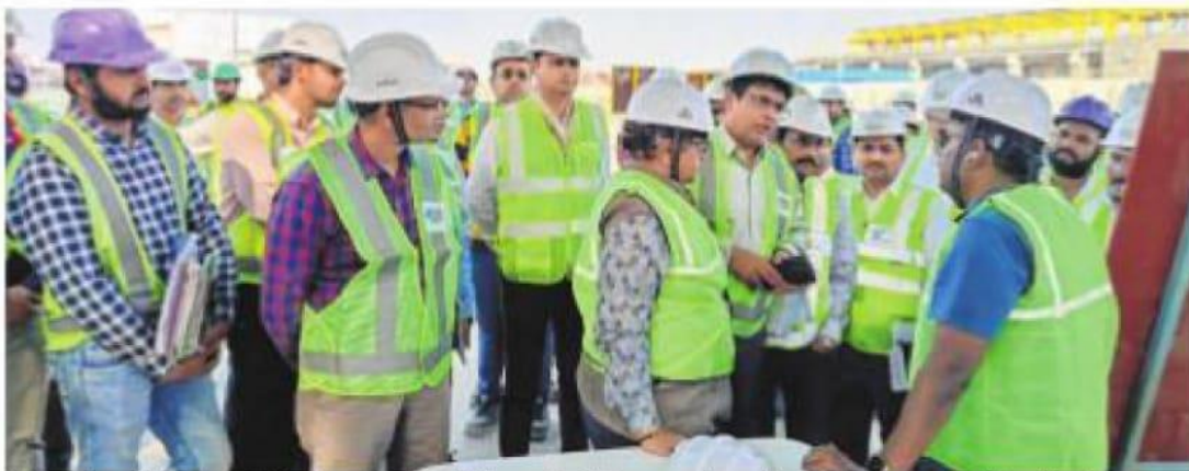
Managing Director of Madhya Pradesh Metro Rail Corporation discussing issues with officials of Indore Metro in the city on Saturday