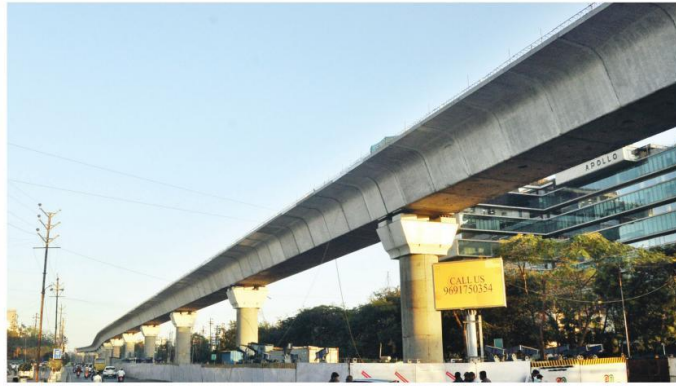
मेट्रो रेल के लिए निर्माण कार्य तेजी से किया जा रहा है। अब एक लंबी दूरी तक डाली गई लाइन दिखाई देने लगी है।