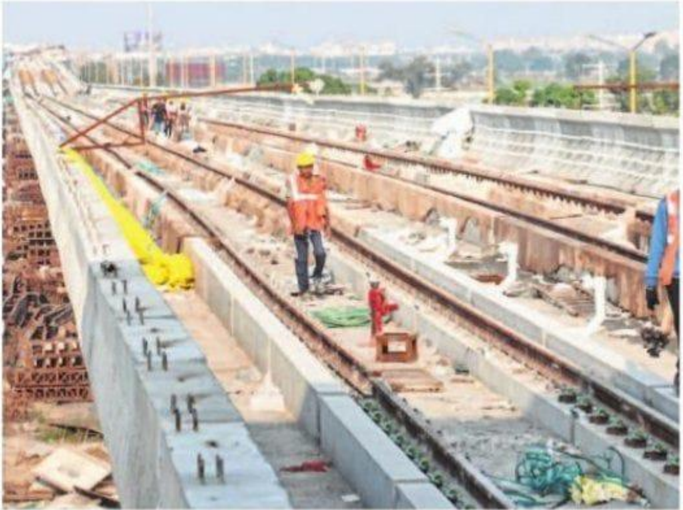
The laying of the second line of Metro Track at Super Corridor-3 started on Tuesday.