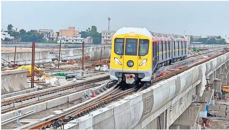
30 सितंबर को किया गए ट्रायल रन के दौरान पटरी पर चलती इंदौर की मेट्रो। फाइल फोटो

सेट के निरीक्षण के लिए मेट्रो प्रबंधन की टीम इस महीने के अंत तक वडोदरा भी जाएगी। इसके बाद वहां से कोच को इंदौर के लिए रवाना किया जाएगा। मेट्रो रेल कार्पोरेशन लिमिटेड द्वारा अप्रैल से जून माह तक गांधीनगर स्टेशन से सुपर कारिडोर पर 5.9 किलोमीटर के हिस्से में टीसीएस चौराहे के पास बने मेट्रो स्टेशन तक मेट्रो का कमर्शियल रन शुरू करने की योजना है। ऐसे में उस समय तक शहर में मेट्रो कोच के तीन सेट पहुंच जायेंगे।