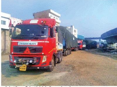
ट्रकों से गांधी नगर डिपो पहुंचे मेट्रो के तीन नए कोच।

25 कोच सेट का संचालन करने की योजना : इंदौर में 25 मेट्रो कोच सेट का संचालन करने की योजना है। गांधी नगर डिपो में पहुंचे मेट्रो के तीन कोच के सेट को ट्रक से अनलोड कर पटरियों पर आधुनिक