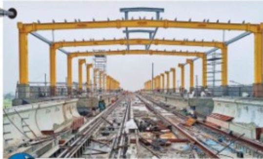
नई दुनिया सबसे पहले मेट्रो स्टेशन सुपर कार्रिडोर नंबर 3

सुपर कार्रिडोर के मेट्रो स्टेशन नंबर एचएच-3 के फ्रेमवर्क पर पर लॉन्ग के 40 बलम लगाए जा चुके हैं। अब उसके ऊपर रॉड लगाने का