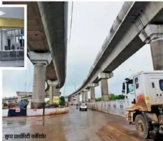
सुपर प्रायोरिटी कारिडोर

आमजन के लिए कर्मशियल उपयोग के लिए इसे अभी शुरू नहीं किया जा रहा है। यानी मेट्रो में नियमित सफर करने के लिए लोगों को अगले साल तक इंतजार करना होगा। मेट्रो स्टेशन पर पीईवी स्ट्रक्चर को बनाने में अधिक समय लगना तय है। स्टेशन, क्रॉस रनर, इलेक्ट्रिसिटी, फ्लोरिंग, सीढ़ियां और लिफ्ट सहित कई काम बचे हैं।