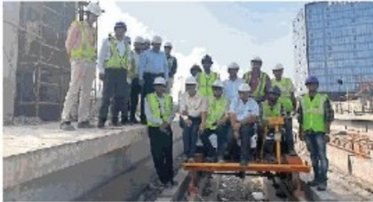
सुभाष नगर डिपो से रानी कमलापति रेलवे स्टेशन के बीच मेट्रो ट्रैक पर ट्राली से ट्रायल रन किया गया। ट्रायल रन करने वाली मेट्रो कंपनी की टीम खुशी जताते हुए। ● बईदुनिया

भोपाल (नईदुनिया प्रतिनिधि)। मेट्रो के ट्रायल रन से पहले रश्मिकार को ट्रैक पर ट्राली रन किया गया, जिसमें मेट्रो ट्रैक पास हो गया है। यानी मेट्रो के ट्रायल रन के लिए ट्रैक पूरी तरह तैयार है। यह ट्राली रन सुभाष नगर से रानी कमलापति रेलवे स्टेशन (आरकेएमपी) के बीच किया गया। असल में मेट्रो के ट्रायल रन के लिए एक माह का ही समय बचा है। इसके लिए प्रायरीटी कारिडोर में जो भी काम बचा है, उसे 20 दिन में पूरा करने का लक्ष्य रखा गया है। ट्रायल रन के लिए सबसे महत्वपूर्ण रेलवे ट्रैक का काम शत-प्रतिशत पूर्ण हो गया है। ट्राली का ट्रायल रन अधिकारियों के तकनीकी दल ने किया है।