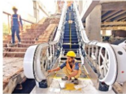
मेट्रो स्टेशन पर 100 से अधिक बिजली खंभे और 100 से अधिक ट्रेक लंबाई बढ़ाए जा रहे हैं।

मंडी-मग डिपो मेट्रो डिपो में 14 सितंबर को होने वाले ट्रायल रन की केवारी ट्रेक पर दी गई है। यहाँ से ट्रेक शुरू होगा। यह निर्माण कार्य को निरंतरता देकर किया जा रहा है। गांधीनगर पर 2025 साल तक भी काम है। गांधीनगर पर भी केवारी की निर्माण कार्य शुरू हैं। सभी आवश्यकताओं का पूरा आयातक से करवा दिया जा रहा है। मेट्रो ट्रेन चलाए जाने के बाद ही गांधीनगर गांधीनगर की केवारी को लेना शुरू की जायेगा। ट्रेक पर शुरू हो मेट्रो स्टेशन को गांधीनगर तक पहुंचाने, साथ ही गांधीनगर, मंडी-मग, गांधीनगर, गांधीनगर पर शुरू हो गांधीनगर के लिए 10 दिन तक शुरू करवाया जा रहा है।