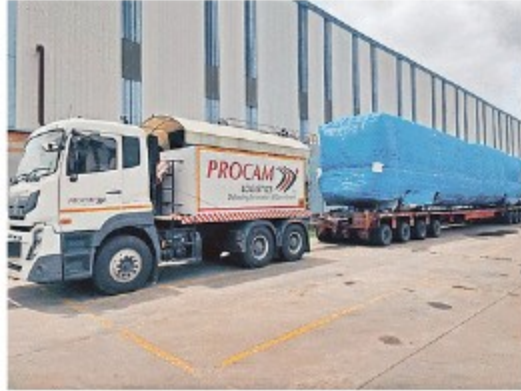
सावली में तैयार हुए तीन कोचों के बुधवार को पहुंचने की संभावना है। • छड़ल कोटो

कोच अनलॉडिंग के लिए पहुंच चुकी है क्रैन : कोचों को पटरों पर पहुंचाने के लिए विशालकाय 'फोर पाईट जैक' क्रैन