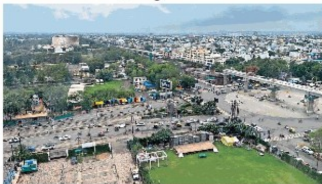
न्यू डेवलपमेंट बैंक द्वारा मिले 1600 करोड़ रुपये की राशि ने से करीब 250 करोड़ रुपये मेट्रो के एलिवेटेड हिस्सों के निर्माण पर खर्च होने। (एन डीबी फोटोग्राफर चक्रवर्ती द्वारा मेट्रो के निर्माण कार्य के दौरान राशि से जारी है।) • चक्रवर्ती

इंदौर में मेट्रो रेल परियोजना के काम के लिए 3200 करोड़ रुपये की दरकार है। इसमें से एनडीबी द्वारा 1600 करोड़ रुपये का ऋण स्विकृत हो जाने के बाद अब मेट्रो के भूमिगत भाग में एशियन डेवलपमेंट बैंक से 1600 करोड़ रुपये का ऋण मिलने का भी इंतजार किया जा रहा है। अभी तक इंदौर में मेट्रो निर्माण के लिए अभी तक केंद्र व राज्य सरकार द्वारा 20-20 प्रतिशत राशि इस्वीटी के रूप में मिली है। अभी इससे निर्माण कार्य हो रहा है।