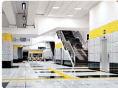
लक्ष्य प्रायिक के लिए तेजी से काम चल रहा है। उम्मीद है कि 25 अगस्त तक इंदौर में मेट्रो ट्रेन का काम आ

पत्रिका रीडर्स फेस्ट पत्रिका युवा नेटवर्क patrika.com इंदौर, मेट्रो स्टेट पर 5 मिनट को खींच चलाना ट्रायल होना है। ट्रेन में लक्ष्य के आकार का काम में तेजी जा रही है। स्टेशन का काम भी शुरू हो गया है। स्टेशन को अकार्यक बनाया जाएगा, उसमें यंत्रियों की सुविधा के लिए सीढ़ी के साथ ही लिफ्ट, एस्केलेटर और दिव्यांगों के लिए रैंप रहेंगे। मेट्रो रेल कॉरपोरेशन के अधिकारियों ने मालवाहा को पूरे ट्रेक का निरीक्षण करने के बाद स्वीकृत किया है। अफसरों का दावा है कि