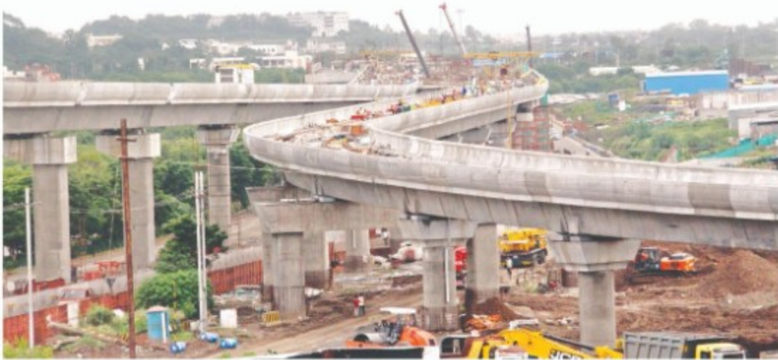
सैलेन्द्र वर्मा | इंदौर

इंदौर मेट्रो ट्रेन के 5.9 किलोमीटर के ट्रैक पर ट्रायल की तैयारियां अंतिम दौर में पहुंच गई हैं। ट्रेन के बीच इंदौर पहुंचने के बाद 5 से 15 सितंबर के बीच इस सिस्टम में मेट्रो ट्रेन का ट्रायल रन शुरू हो जाएगा। मेट्रो के इस ट्रैक का निर्माण 1 साल 7 माह में पूरा हुआ, जो देशभर के अलग-अलग शहरों में चल रहे मेट्रो के निर्माण में सबसे तेज गति से होने वाला कंस्ट्रक्शन है। मुख्यमंत्री शिवराज सिंह चौहान ने मेट्रो के प्रायोरिटी कॉरिडोर के निर्माण की आधार शिला दिसम्बर 2021 में रखी थी, जिसके बाद रेल विकास निगम लिमिटेड ने जनवरी 2022 में इसका निर्माण शुरू कर दिया। अब अगस्त 2023 में यह ट्रैक टेस्टिंग के लिए लगभग तैयार हो चुका है। वर्तमान में देश के 16 शहरों में मेट्रो ट्रेन दौड़ रही हैं, वहीं 25 से अधिक शहरों में मेट्रो का निर्माण जारी है।