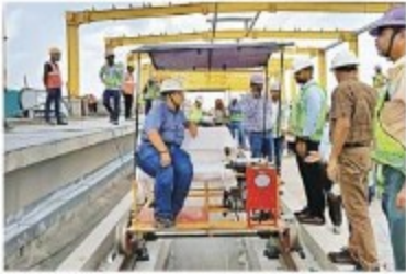
मेट्रो रेल कॉर्पोरेशन लि. के इन्फोर्स्टर क्लास १३०० ने संकेत को मेट्रो के ट्रायल रन करने हिस्से पर ट्रेक का निरीक्षण किया। ● मेट्रो छात्र

राष्ट्र में जहाँ मेट्रो ट्रेन चलाने की कवायद जोर पकड़ रही और अगले पाह्र टाइम रन भी होने वाला है। दूसरी ओर इंदौर में लक्ष्मण चौक से महाकाल मंदिर तक रैपिड रेल ट्रांजिट सिस्टम (आरआरटीएस) भी बनाने की कवायद जोर में है। इसके लिए दिल्ली मेट्रो रेल कॉर्पोरेशन को आरआरटीएस प्रोजेक्ट को जिम्मा देने की योजना है। ऐसे में उज्जैन से इंदौर से एग्जिप्टेड ट्रेन में बैठकर उज्जैन जा सकेंगे। नेशनल कैपिटल रीजन ट्रांसपोर्ट कॉर्पोरेशन द्वारा दिल्ली से मेट्रो के बीच शुरू की आरआरटीएस के बाद इंदौर से उज्जैन के बीच इस तरह की ट्रेन सेवा का यह दूसरा प्रोजेक्ट देखा में होगा। यह संभावना जताते जा रही हैं कि इंदौर में 14 सितंबर को होने वाले ट्रायल रन कार्यक्रम में