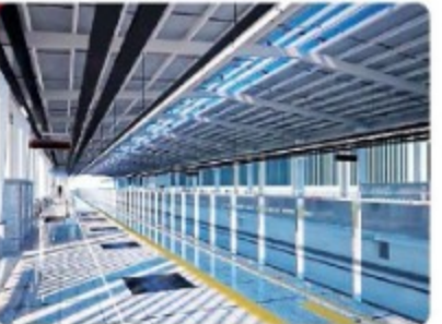
विद्यार्थन का काम लगभग पूरा हो गया है। ट्रेक पर 90 प्रतिशत हिस्से में पटरी बिछाई जा चुकी है। साथ साथ भी इन यंत्रों पर हो जाएगा। ट्रेक पर 5.9 किलोमीटर हिस्से में पटरी बिछाई जायेगी।

दूसरी मजिल पर होगा प्लेटफॉर्म अधिकारियों को स्टेशन की विषयगत फिर पुरा है। जिसके अन्तर्गत पर काम चल रहा है। पटरी मजिल पर यंत्रियों के लिए सुविधा की सारी व्यवस्थाओं के साथ ही लिफ्ट बिछानी भी होगी। दूसरी मजिल पर प्लेटफॉर्म होगा। पटरी व प्लेटफॉर्म के बीच दुल्हा दुल्हा व्यवस्था रहेंगी, जो मेट्रो के पटरी पर अवरन बड़े होने के फायदे हो यंत्रियों को प्रोग्राम करने की अनुमति देनी। कन्वर्से-कॉन्वर्सी गड तक कुछ कॉन्वर्सेरल ब्लॉक के स्टेशन प्लेटफॉर्म का काम तेज गति से किया जा रहा है। उसके साथ छत को सुरक्षित कर अन्य सुविधाओं को अंतिम रूप दिया जाएगा। मेट्रो कॉरपोरेशन का प्रयास है कि निर्धारित डेटलाइन तक सभी का काम के अनुसार पूर्ण कर लिया जाए।