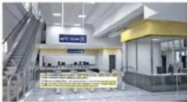
अंडरग्राउंड स्टेशन का डिजाइन ऐसा होगा।

सरकार ने सितंबर 2023 डेडलाइन तय की है। इसलिए छुट्टी के दिन भी काम किया जा रहा है। श्रमिकों की संख्या बढ़ा दी गई है। हालांकि गांधी नगर से लेकर 5.9 किमी यानी टीसीएस चौराहे तक ट्रायल होगा।