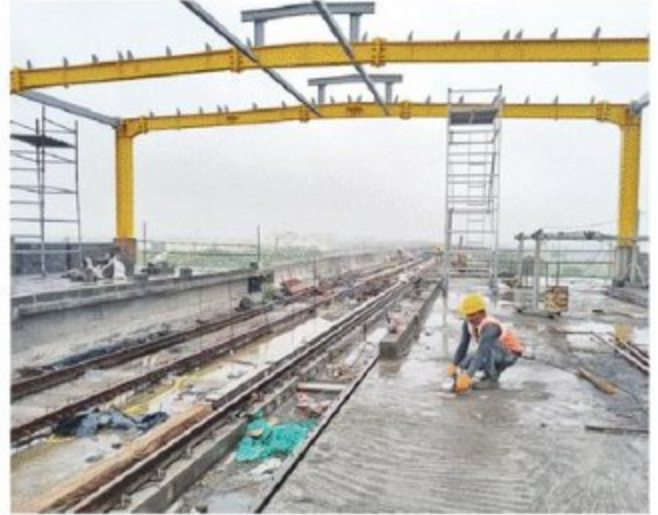
ट्रायल रन के लिए इंदौर में मेट्रो का काम तेज गति से चल रहा है। ● नईदुनिया

सार्वजनिक यातायात साधनों का उपयोग करने से है। दिल्ली में मेट्रो की सफलता की बड़ी वजह यही है कि लोग अपने या सार्वजनिक वाहनों से मेट्रो स्टेशन पर पहुंचते हैं। मेट्रो से गंतव्य पर पहुंचते हैं और फिर लौटकर अपने वाहन से घर पहुंच जाते हैं। वे तेज और सुविधाजनक मेट्रो का युक्तियुक्त उपयोग कर लेते हैं। सार यही है कि शहरवासियों को नजदीकी मेट्रो स्टेशन तक पहुंचने के लिए पैदल या फिर सार्वजनिक वाहनों के उपयोग की आदत विकसित करनी होगी। तभी मेट्रो का सफर शानदार बन जाएगा।