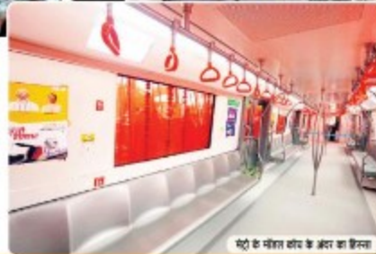
मेट्रो के मॉडल कोच के अंदर का दृश्य