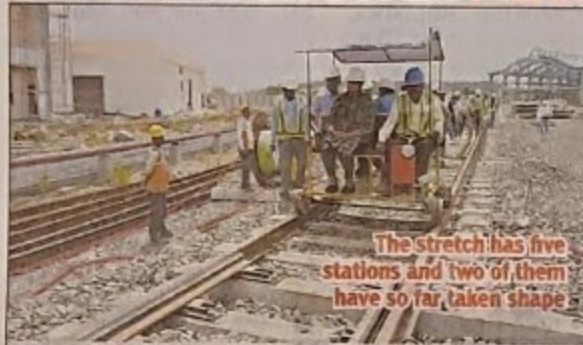
Madhya Pradesh Metro Rail Corporation Limited AMD take stock of Metro tracks three days ago

The officials, who are yet to receive any information, are expecting the state government to organise a programme to mark the start of the trial run as the much-talked about project is a new mode