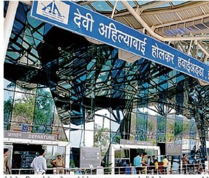
मेट्रो के भूमिगत प्रोजेक्ट में एयरपोर्ट के पास काम शुरू करने की है योजना। • काइल फोटो

चार टीवीएम का होगा उपयोग मेट्रो के भूमिगत हिस्से में सुरंग बनाने के लिए टनल बोरिंग मशीन ( टीवीएम) का उपयोग किया जाएगा। जमीन की 60 फीट गहराई में कैसल जैसे स्वरूप में यह मशीन सुरंग का निर्माण करेगी। इंदौर में भूमिगत हिस्से के निर्माण के लिए चार टीवीएम का उपयोग किया जाएगा। इसमें दो मशीन एयरपोर्ट वाले हिस्से में काम शुरू करती हुई बड़ा गणपति की ओर बढ़ेंगी। बाकी दो मशीनें बड़ा गणपति चौगहे के पास सुरंग बनाती हुई हाई कोटं की ओर बढ़ेंगी। एजेंसी तय होने के बाद करीब आठ से दस माह में टीवीएम इंदौर पहुंचने की संभावना है।