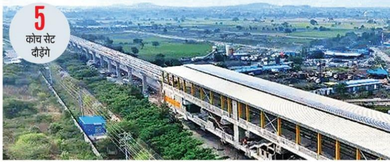
सुपर कारिडोर पर मेट्रो का स्टेशन नंबर तीन। यहां से गांधी नगर स्टेशन के बीच होगा मेट्रो का कमर्शियल रन। • फ़लन फोटो

अगरत बाद आएं आठ कोच मेट्रो के निर्माण की रफ्तार अभी थोड़ी धीमी जरूरत हुई है, लेकिन प्राथमिक कारिडोर के बाद मेट्रो प्रबंधन द्वारा रेडिसन चौराहे तक मार्च 2025 तक अगले एक साल में मेट्रो के संचालन की योजना बनाई गई। वर्तमान में पांच मेट्रो कोच सेट आ चुके हैं। अगरत बाद एक-एक करके अन्य आठ कोच भी वडोवरा से आएं। ऐसे में रेडिसन तक मेट्रो ट्रेन का संचालन शुरू होने तक इंदौर में मेट्रो प्रबंधन के बेड़े में 13 कोच होंगे। इसके माध्यम से मेट्रो का संचालन होगा। स्टेशन पर फनिशिंग का कार्य किया जा रहा है।