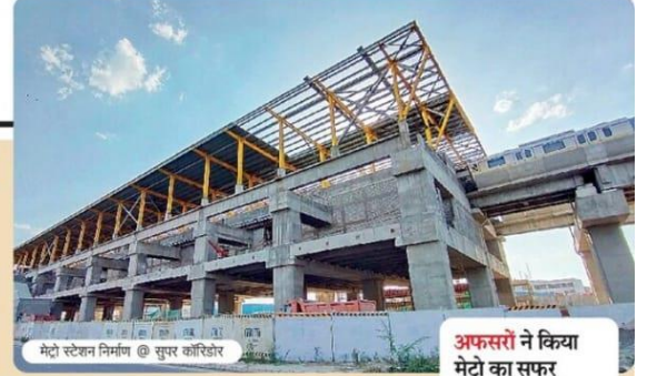
मेट्रो स्टेशन निर्माण