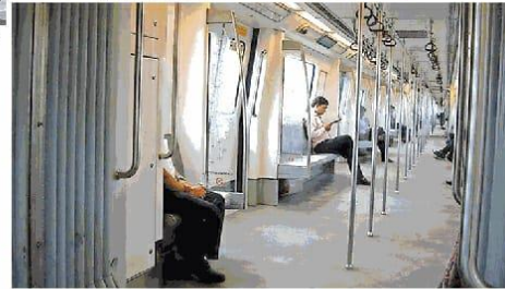
अंदर से कुछ ऐसे होंगे इंदौर मेट्रो के कोच। • प्रतीकालोक फोटो