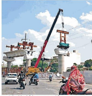
यहाँ चौराहे पर मेट्रो का ऊँची से चल रहा काम। ● नईदुनिया

यहाँ पर डबल बनाने के साथ-साथ डिपो का काम भी तेजी से चल रहा है। डिपो में पटरों बिछाना शुरू कर दी गई है। मेट्रो रेल कर्पोरेशन के एमडी मनीष सिंह इंदौर का दौरा कर यहाँ चल रहे कामों का निरीक्षण कर रहे हैं।