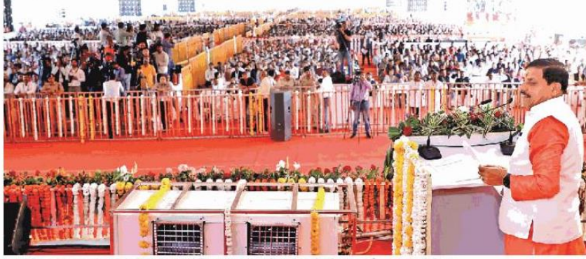
मुख्यमंत्री डा. मोहन यादव ने लाल परेड मैदान में स्वच्छ सर्वेक्षण-2023 के कार्यक्रम को संबोधित किया।

भोपाल (राज्य ब्यूरो) । मुख्यमंत्री डा. मोहन यादव ने मंगलवार को भोपाल के लाल परेड मैदान में आयोजित स्वच्छ सर्वेक्षण-2023 में श्रेष्ठ कार्य के लिए पुरस्कार वितरण समारोह में नगरीय निकायों के विकास कार्यों के लिए 1000 करोड़ रुपये की राशि का अंतरण किया। इस अवसर पर भोपाल मेट्रो परियोजना के दूसरे चरण के लिए आठ स्टेशनों का भूमिपूजन भी किया गया। उन्होंने कहा कि प्रदेश में रेलवे ब्रॉडगैज रूल्स कले के लिए 105 रेलवे ओवर ब्रिज निर्माण के साथ ही 334 पुलों के निर्माण की प्रक्रिया प्रारंभ की गई है। मुख्यमंत्री ने कार्यक्रम में "स्वच्छ हम" पुस्तिका एवं जल माल प्रबचन नीति 52024 का विमोचन भी किया। कार्यक्रम का प्रसारण प्रदेश के सभी 413 निकायों में किया गया।