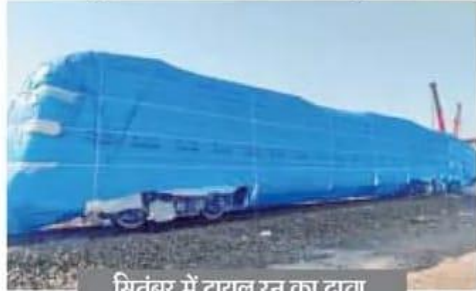
सितंबर में ट्रायल रन का दावा

गुजरात के सांवली (बड़ोदरा) से मंगलवार को एक और मेट्रो ट्रेन भोपाल आ गई। इसे मिलाकर अब तक भोपाल में 5 मेट्रो ट्रेन आ चुकी हैं। शहर में दो रूट पर 27 मेट्रो ट्रेन चलाई जानी है। भोपाल में सबसे पहली मेट्रो ट्रेन पिछले साल सितंबर में आई थी। इसे 3 अक्टूबर को ट्रायल रन के लिए ट्रैक पर चलाया गया था। यह ट्रेन बीच-बीच में ट्रैक पर चलते हुए देखी जा सकती है। इसके बाद फरवरी में 2 मेट्रो ट्रेन और आईं। ये डिपो के भीतर टेस्ट ट्रैक पर चल रही हैं। यह फाइनल ट्रायल के लिए मुख्य ट्रैक पर जल्द आएंगी। चौथी ट्रेन 12 मार्च को आई थी। इसके ठीक 6 दिन बाद मंगलवार को एक और मेट्रो ट्रेन आ गई। कोच को बड़ी क्रेन की मदद से सुभाष नगर डिपो में उतारा गया।