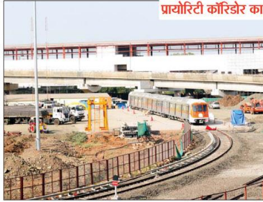
सुभाष नगर स्थित मेट्रो स्टेशन और डिपो का काम लगभग पूरा हो गया है।

जागरण, भोपाल। भोपाल मेट्रो की ऑरेंज लाइन के दूसरे फेज का काम मंगलवार से शुरू हो गया है। मुख्यमंत्री डॉ. मोहन यादव ने इसकी वचुअल शुरुआत की। सीएम ने वचुअली भूमिपूजन किया। सेकंड फेज में सुभाष नगर से करोंद चौराहे तक 8.77 किलोमीटर की लाइन बिछाई जाएगी। इसमें 3.39 किलोमीटर का हिस्सा अंडरग्राउंड होगा। इस रूट पर 8 मेट्रो स्टेशन बनेंगे, जिसमें से दो अंडरग्राउंड लाइन में होंगे। दूसरे फेज को बनाने में 1540 करोड़ रुपए खर्च होंगे। काम को पूरा करने के लिए 3 साल का समय तय किया गया है। बता दें कि भोपाल में दो रूट ऑरेंज और ब्लू लाइन तय किए गए हैं। फिलहाल ऑरेंज रूट पर ही काम चल रहा है, जो एम्स से करोंद चौराहे तक है। ब्लू रूट भदभदा से रत्नागिरी तक तय किया गया है।