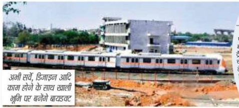
अभी सर्वे, डिजाइनिंग आदि काम होने के साथ खाली भूमि पर बनेंगे बायव्हाइट

चौथी ट्रेन को बुधवार को डिपो में उतारा गया, टेक्निकल टेस्टिंग हो रही