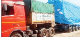
टेस्ट ट्रेक पर चलाई जा रही हैं ट्रेनें

जागरण, भोपाल। राजधानी भोपाल में मेट्रो ट्रेन का काम तेजी से जारी है। जल्द ही एक बार फिर प्रायोरिटी ट्रेक पर मेट्रो रेल चलनी नजर आएगी। दरअसल भोपाल मेट्रो के सुभाष नगर डिपो में अब तक 4 ट्रेनें पहुंच चुकी हैं। इनमें से एक ट्रेन को 4 अक्टूबर 2023 में ट्रेक पर चलाकर भी देखा गया था। अन्य दो ट्रेनें भी ट्रायल रन के लिए लगभग तैयार हैं। दोनों को एक साथ ट्रेक पर चलाने की तैयारी चल रही है। बुधवार को चौथी मेट्रो ट्रेन गुजरात के सावली (बदोदरा) से भोपाल पहुंच गई। अब इसको टेक्निकल टैरिफिंग की जा रही है। भोपाल में कुल 27 और इंटीर में 25 मेट्रो चालीं। हर मेट्रो ट्रेन में 3-3 कोच हैं। दोनों ही शहरों में 4-4 मेट्रो ट्रेन आ चुकी हैं। इंटीर में भी दो-तीन दिन पहले ही मेट्रो पहुंची है।