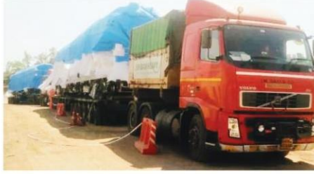
भोपाल ■ राज न्यूज नेटवर्क

गुजरात से लंबा सफर तय कर मंगलवार शाम को एक और मेट्रो ट्रेन भोपाल पहुंच गई। इसे सुभाष नगर स्थित मेट्रो डिपो में अनलॉड किया जाएगा। फिर डिपो में जरूरी टेस्टिंग के बाद इसका भी ट्रायल रन किया जाएगा। अब कुल चार मेट्रो हो गई है। पांचवीं ट्रेन भी इसी महीने आने की संभावना है। अलस्टॉम इंडिया लिमिटेड गुजरात के वडोदरा स्थित सावली प्लांट में मेट्रो रेल का निर्माण कर रही है। प्रत्येक रेल में तीन कोच हैं। पहली ट्रेन पिछले साल सितंबर में राजधानी पहुंची थी। इसके साथ अक्टूबर में ट्रायल रन की शुरुआत की गई थी। यहां बता दें कि सुभाष नगर से एम्स के बीच मेट्रो ट्रेन का पैसेंजर रन सितंबर तक शुरू करने का टारगेट है। इसके लिए न्यूनतम चार से पांच ट्रेन होना अनिवार्य है। इसमें से एक ट्रेन बैक अप या रिजर्व के तौर पर रहेगी।