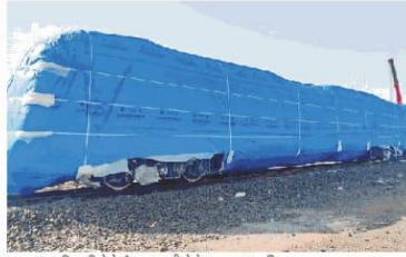
सुभाष नगर स्थित डिपो के ट्रैक पर खड़ी मेट्रो।

बता दें कि तीन अक्टूबर को मेट्रो का ट्रायल रन किया गया था। अब इसकी स्टीन टेस्टिंग आरम्भ होने से सुभाष नगर डिपो के बीच की जा रही है। इसमें अधिकारी मेट्रो के पाटस और उसके कन्सुल्टेंट्स को सम्मिलित करेंगे हैं। अब इसका डेवलपमेंट कर देखा जाएगा कि मेट्रो व ट्रैक में कोई