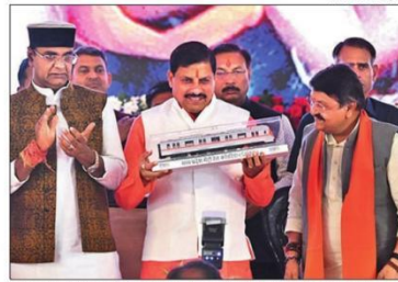
CM Mohan Yadav with a replica of a metro coach during foundation stone laying ceremony of 8 metro stations, at Lal Parade Ground on Tuesday. Urban development and housing minister Kailash Vijayvargiya and cooperative minister Vishwas Sarang were also present

A total of Rs 1540 crore will be spent to lay the 8.77 km line from Subhash Nagar to Karond, the second phase of the Orange Line of Bhopal Metro. These include 8 metro stations. 3.39 km route will be