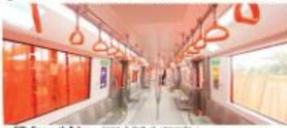
आम लोगों के लिए खुला मेट्रो का माडल कोच

भोपाल: प्रशासनिक, आवासीय, वाणिज्यिक क्षेत्रों में स्मार्ट सिटी बनाने में मदद कर सकने के लक्ष्य के तहत मेट्रो कोच का माडल कोच को आम लोगों के लिए खुला किया जा रहा है। मेट्रो कोच को आम लोगों के लिए खुला करने का उद्देश्य आम लोगों को मेट्रो कोच के अंदर की सुविधाओं का अनुभव कराना है।