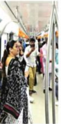
सुबह 11 से रात 9 बजे तक देख सकते कोच: मेट्रो मॉडल कोच के अंदर आमजन को आसपास के लिए विभिन्न प्रकार के फीचर के माध्यम से प्रोमोटिव कोच बनाने का उद्देश्य है। इस आनंददायक क्षण को मेट्रो मॉडल कोच को देखने और आमजन का आनंद मिल सके, आह्वान किया कि उनका सेल्फी जमाने और फोटोविक डैशबोर्ड के माध्यम से दे सकते हैं।