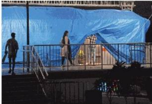
मेट्रो के माडल कोच को श्यामला हिल्स स्थित स्मार्ट सिटी पार्क में पालीथिन से ढककर रखा गया है। यहां आने वाले लोग इसे खोलकर देख रहे हैं।

सिर्फ देख सकेंगे बल्कि अनुभव भी ले सकेंगे। इसमें यात्रियों को मेट्रो स्टेशन का अनुभव होगा, जिसमें बकबत मेट्रो में आपका स्वागत है... अगला स्टेशन एम्स है... दरवाजे बाईं तरफ खुलेंगे... कृपया दरवाजों से हटकर खड़े हों जैसे निर्देश सुनाई दें।