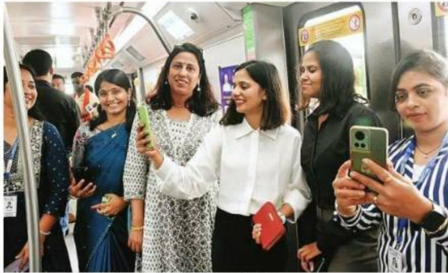
स्मार्ट रोड स्थित स्मार्ट पार्कमें रखे मेट्रो ट्रेन के मॉडल के साथ राजधानी की रेलकी लेटी महिलाएं।

इस दौरान मुख्यमंत्री ने लोगों से वादा किया कि मेट्रो ट्रेन सिर्फ भोपाल तक सीमित नहीं रहेगी, बल्कि उसे मंडीदीप तक चलाएगी। वहीं बैरागढ़ होते हुए यह सीहोर तक भी जाएगी। उन्होंने कहा कि भोपाल में मेट्रो प्रोजेक्ट रफ्तार पकड़ चुका है और जल्द ही अपनी मंजिल तक पहुंचेगा। मेट्रो ट्रेन का ट्रायल रन इंदौर और भोपाल में सितंबर माह में आरंभ हो जाएगा और अप्रैल-मई तक मेट्रो ट्रेन चलाने लगेगी। मुख्यमंत्री ने कहा कि अब राजधानी भोपाल और इंदौर मेट्रो रेल सिटी होंगी। मेट्रो ट्रेन से जनता को बहुत सुविधाएं मिलेंगी। इससे अवागमन का समय बचेगा और सफर भी आरामदायक होगा।