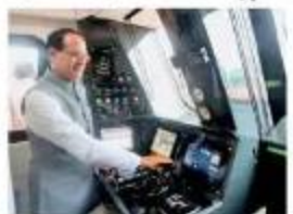
मूडरनेमी शिवराज मिश्र चौधन मॉडल कोच में पावरफुल रॉय मुक्कुर में रिखाई दिता

भोपाल। भोपाल मेट्रो पर्यटन और बोरिंग होते हुए सीहोर तक जाएगा। रनिवार को स्मार्ट फर्क में मेट्रो के मॉडल कोच के अनावरण के दौरान सीएम शिवराज मिश्र चौधन ने यह घोषणा की। उन्होंने कहा- हमने 2016 में भोपाल और इंदौर को मेट्रो मिली बन्दों का सपना देखा था। अगले साल अलूनी-नई तक दोनों शहरों में मेट्रो शुरू हो जाएगी। मूलभूतों ने अलग लक्ष्य कि 15 मिनट की बरिगम साकर में मेट्रो का काम एक मिनट का। सिस्तर में इंदौर और भोपाल दोनों शहरों में उपन करेगा। इंदौर के बारे में यह घोषणा करेगा। सुबह 11 से रात 9 बजे तक देखा सकेगा। मॉडल कोच एक है जैसे फोटोशॉप पर खड़ी मेट्रो। पर फलतः कोच है, जिसमें पावरफुल पीट भी है। इसमें 50 लोगों के बैठने के साथ 250 लोग खड़े रह सकते हैं। इसे सहायकों मुचा देखा सकेगा।