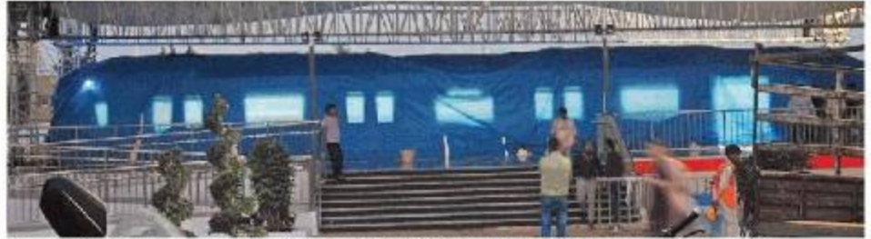
भोपाल मेट्रो के कोच का माडल श्यामला हिल्स स्थित स्मार्ट सिटी पार्क में आमजन के देखने के लिए रखा गया है। ● नवदुनिया

पटरी पर नहीं दौड़ेगा, लेकिन सबकुछ असली : मेट्रो माडल कोच पटरी पर तो नहीं दौड़े सकेगा, लेकिन इसमें सब कुछ असली जैसा ही रहेगा इसको आमजन न