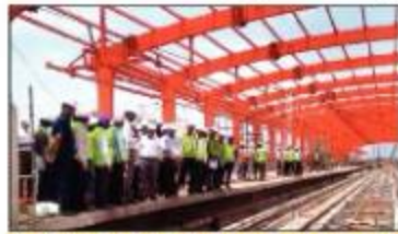
बिजली साप्लाइ के लिए 25 किमी केबल बिछाने का काम पूरा