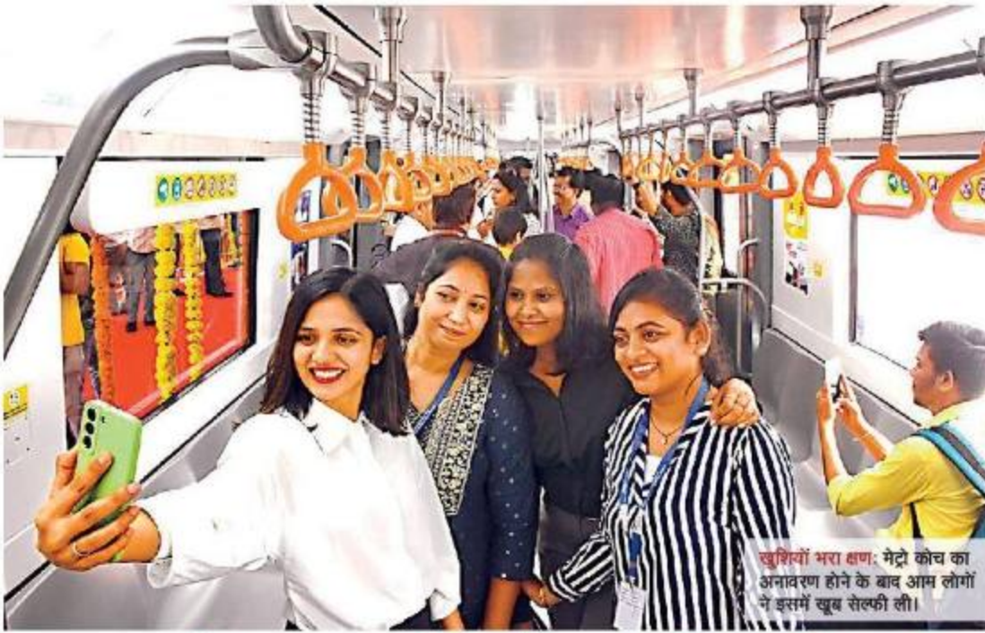
खुशियों भरा क्षण: मेट्रो कोच का अनावरण होने के बाद आम लोगों ने इसमें खूब सेल्फी ली।