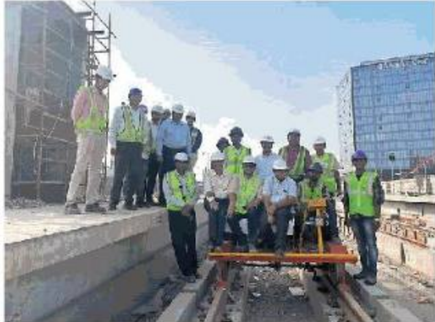
सुभाष नगर डिपो से रानी कमलापति स्टेशन के बीच मेट्रो ट्रैक पर टाली से ट्रायल रन किया गया। ट्रायल रन करने वाली मेट्रो कंपनी की टीम भी संतुष्ट दिखी। ● नवदुनिया

● अब 20 दिन में पूरा होना है विद्युतीकरण का काम, एक माह में दौड़ेगी ट्रायल के लिए मेट्रो ट्रेन