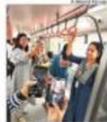
Visitors check photos in the metro model coach in Bhopal on Saturday.

MP Metro Rail Corporation Limited (MPSRCL) has been constituted to implement the metro rail projects in the state. Both projects are expected to be completed soon.