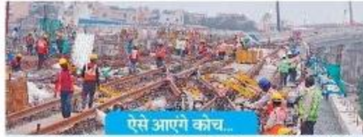
ऐसे आएंगे कोच...