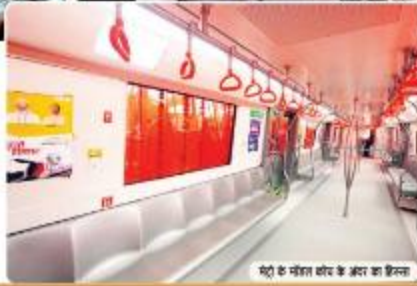
मेट्रो के मॉडल कोच के अंदर का दृश्य