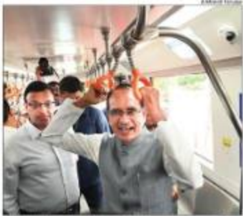
CM Shriyog Singh Chauthan at metro model coach unveiling ceremony in Bhopal.

The coach will be operational after about six months of trial from September. "It will be a milestone in the development of MP. I have full faith that passenger operations will start next year," he said. The coach has the highest safety rating, say officials. The metro will have