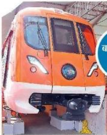
राजधानी में ऐसे इंजन से रफ्तार लेगी मेट्रो।