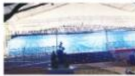
लम्बाई की है। इसकी लम्बाई 7 हजार किलो मीटर है। अधिक लम्बाई का कारों के बीच से खोल रहा है। मेट्रो में पानी लाना निर्माणाधीन है। इसकी कुल लम्बाई 31 किलोमीटर एवं लम्बा 7500 किलो है।

पुलवामो सिविल इंजिनियरिंग विभाग द्वारा 9.45 बजे सवाई सिद्धी पार्क में मेट्रो मॉडल कोच का अनावरण किया। यह मेट्रो ट्रेन का प्रारंभिक मॉडल है। अनावरण के बाद मॉडल कोच को बसों एवं अन्य स्थलों के बीच खोलना जाएगा। मेट्रो ट्रेन द्वारा प्रसार के 3 कोच से किए गए बखर्ची है। भोपाल में 5 एच डीटीए में 4 किलोमीटर लम्बाई के मेट्रो ट्रायल स्न की तैयारी तेजी से की जा रही है। भोपाल में अधिकतम मेट्रो मॉडल कोच को 17 किलोमीटर और बच्चा स्टेशन भद्रभद्र भोपाल से सवाई सिद्धी पार्क तक 14 किलोमीटर की