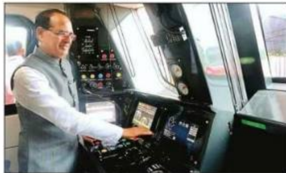
मेट्रो ट्रेन के मॉडल को देखते मुख्यमंत्री शिवराज सिंह चौहान।

मेट्रो के ट्रायल रन की तैयारी: जानकारी के अनुसार, भोपाल में 5 किलोमीटर लंबाई में मेट्रो ट्रायल रन की तैयारी तेजी से की जा रही है। राजधानी में मेट्रो की अर्रिज एवं ब्लू लाइन निर्माणाधीन है, जिसकी कुल लंबाई 31 किलोमीटर और इसकी लागत करीब 7 हजार करोड़ रुपये है। इसी तरह अर्रिज लाइन करोंद चौराहा से एएस तक 17 किलोमीटर और ब्लू लाइन भदमदा चौराहा से रत्नागिरी चौराहे तक 14 किलोमीटर की है। अर्रिज लाइन पर निर्माण कार्य इस समय तेजी से चल रहा है।