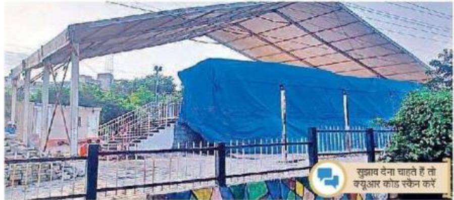
स्मार्ट सिटी पाक्रे में मेट्रो का कोच रखा हुआ है।

भोपाल. आगामी माह सितंबर शहर के लिए सौगातों वाला साबित होगा। मेट्रो ट्रेन सितंबर आखिर तक पटरी पर चलती नजर आएगी। जबकि करोड़ रेलवे ओवरब्रिज और गणेश मंदिर से गायत्री मंदिर तक जीजी फ्लाईओवर पर भी ट्रैफिक शुरू हो जाएगा। 11 माह में काम पूरा करने के दावे के साथ कोलार सिक्सलेन का काम शुरू हुआ था, लेकिन सितंबर में इसका एक हिस्सा तैयार हो जाएगा। यानि छह लेन में से तीन लेन सीमेंट कांक्रीट की तैयार होगी और यहां ट्रैफिक चलता नजर आएगा।