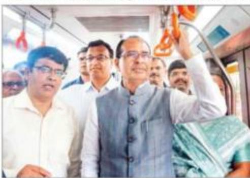
भोपाल में सीएम ने मेट्रो माडल कोच का अनावरण किया।

भोपाल: प्रशासनिक, आवासीय, वाणिज्यिक क्षेत्रों में स्मार्ट सिटी बनाने में मदद कर सकने के लक्ष्य के तहत मेट्रो कोच का माडल कोच को आम लोगों के लिए खुला किया जा रहा है। मेट्रो कोच को आम लोगों के लिए खुला करने का उद्देश्य आम लोगों को मेट्रो कोच के अंदर की सुविधाओं का अनुभव कराना है।