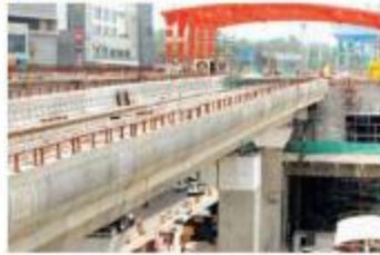
प्रदेश टुडे संवाददाता, भोपाल

RKMP से सुभाष नगर तक 90 फीसदी तक काम पूरा