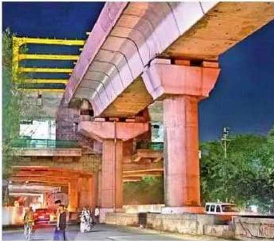
रेडिसन चौराहे से रोबोट चौराहे के बीच ट्रैक व स्टेशन का काम चल रहा।