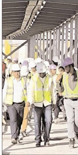
कॉरिडोर का निरीक्षण करते अफसर।

इंदौरवासियों को जुलाई 2025 तक मेट्रो के पहले चरण की यात्रा करवाने का लक्ष्य रखकर मेट्रो रेल कॉर्पोरेशन काम कर रहा है। वर्तमान में 5.9 किलोमीटर के सुपर प्रायोरिटी कॉरिडोर में मेट्रो रेल सुरक्षा आयुक्त द्वारा निरीक्षण किया जा चुका है। इसके बाद मेट्रो के अधिकारियों ने 11 किलोमीटर के हिस्से में ट्रेन चलाने के लिए तैयारी शुरू कर दी है। शुक्रवार को मेट्रो रेल कॉर्पोरेशन के एमडी एस. कृष्ण चैतन्य और अधिकारियों ने निरीक्षण कर ठेकेदार कंसल्टेंट को समन्वय बनाकर बचे हुए काम को तेजी से समयसीमा में पूर्ण करने के निर्देश दिए।