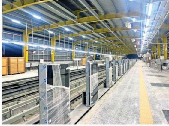
सुपर प्रायोरिटी कारिडोर पर बने मेट्रो स्टेशन पर यात्री सुविधाओं के निरीक्षण के लिए आएगी सीएमआरएस की टीम।