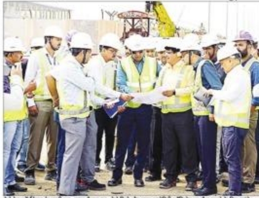
मेट्रो रेल कॉर्पोरेशन के एग्जीक्यूटिव, कुल्लु वैलन्थ पुनः मेट्रो लिमिटेड और सुपर इन्फ्रास्ट्रक्चर कॉर्पोरेशन का दौरा करने के लिए पहुंचे।

वीरगन्धर्व संवाददाता • इंदौर सं.नं. 9584460010