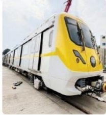
● इंदौर / राज न्यूज नेटवर्क

इंदौर के सभी मेट्रो स्टेशनों पर अनुकूलित व्यवस्थाओं का समर्थन किया गया है। फिलहाल प्राथमिकी कॉरिडोर के 6 मेट्रो स्टेशन काम अंतिम चरण में आ चुका है। इन स्टेशनों पर जांचियों के अंदर जाने के लिए दो एंटी दो एंजिन मेट रहे गए हैं। इसके अलावा दो एस्केलर और दो लिफ्ट भी खरीदी। फुट ओवर ब्रिज के साथ प्रवेश और निष्काशन भी बनाया गया है। स्टेशनों को कैडितीयर सरचना के साथ डिजाइन किया गया है। इनको लंबाई 140 मीटर और चौड़ाई 21 मीटर है। सुरक्षा के भी खास इंतजाम किए गए हैं।