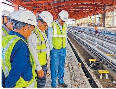
डीआरएम ऑफिस स्टेशन का निरीक्षण करते हुए अधिकारी।